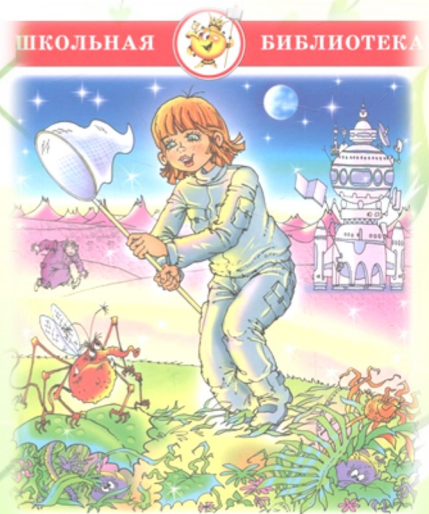
Кир Булычёв ДЕВОЧКА С ЗЕМЛИ

Интересная книга из большой серии историй о девочке из будущего - Алисе Селезнёвой. Кир Булычёв написал замечательную повесть, рассказывающую о летних приключениях Алисы. В команде своего папы, вместе с механиком Зелёным и капитаном Полосковым, она на звездолёте отправилась помогать искать новые виды животных для КосмоЗоо.