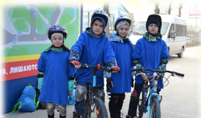
На конкурсе «Безопасное колесо» - 4Д

Место для вождения оборудовано настоящими светофорами, нанесена дорожная разметка, установ-