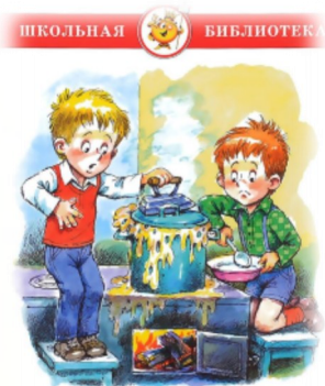
Николай Носов МИШКИНА КАША

Очень смешная история о том, как НЕ НАДО быть самостоятельным. Из этого рассказа можно почерпнуть много нового и интересного о «взрослой жизни без родителей».