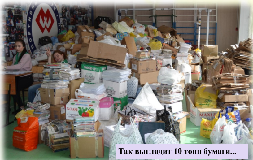
Так выглядит 10 тонн бумаги...