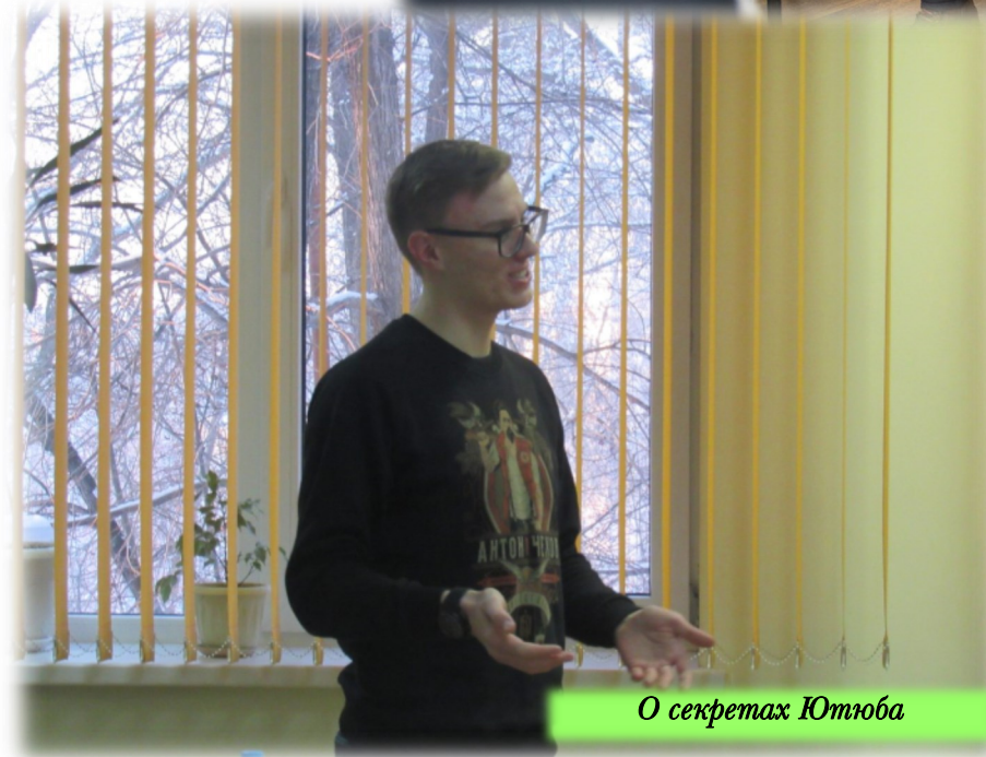
О секретах Ютуба

Стремление к качественному контенту = двигатель прогресса в видеоблогерском деле. Пытаться создавать новое, экспериментировать с жанрами, способами подачи, монтажом и прочее – вот что значит тернистый путь к успеху. Конечно, кто вам мешает пойти по пути «снимаю то, что люди смотрят» – лайфхаки, челленджи, пранки и прочие одноразовые темы. Но вы должны понимать, что данного контента много. Вы не будете выгодны, вы не будете выделяться, вы не будете интересны. Помните, что на дешёвом хайпе далеко не уедешь. Но всё же самое главное – просто не бояться!