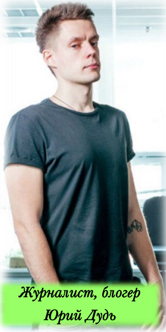
Журналист, блогер Юрий Дудь

Несмотря на многие сходства, отличие всё же есть – ОТВЕТСТВЕННОСТЬ . Если блогер независим и «говорит на камеру всё, что думает», то журналист «говорит на камеру только правильное». В качестве примера хорошего блогера-журналиста Никита Лопатин приводит Юрия Дудя – российского спортивного журналиста, интервьюера и видеоблогера, канал которого насчитывает свыше двух миллионов подписчиков.