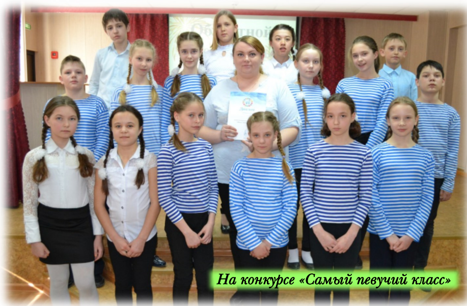
На конкурсе «Самый певучий класс»