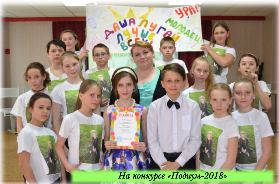
На конкурсе «Подиум-2018»