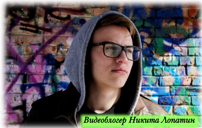
Видеоблогер Никита Лопатин