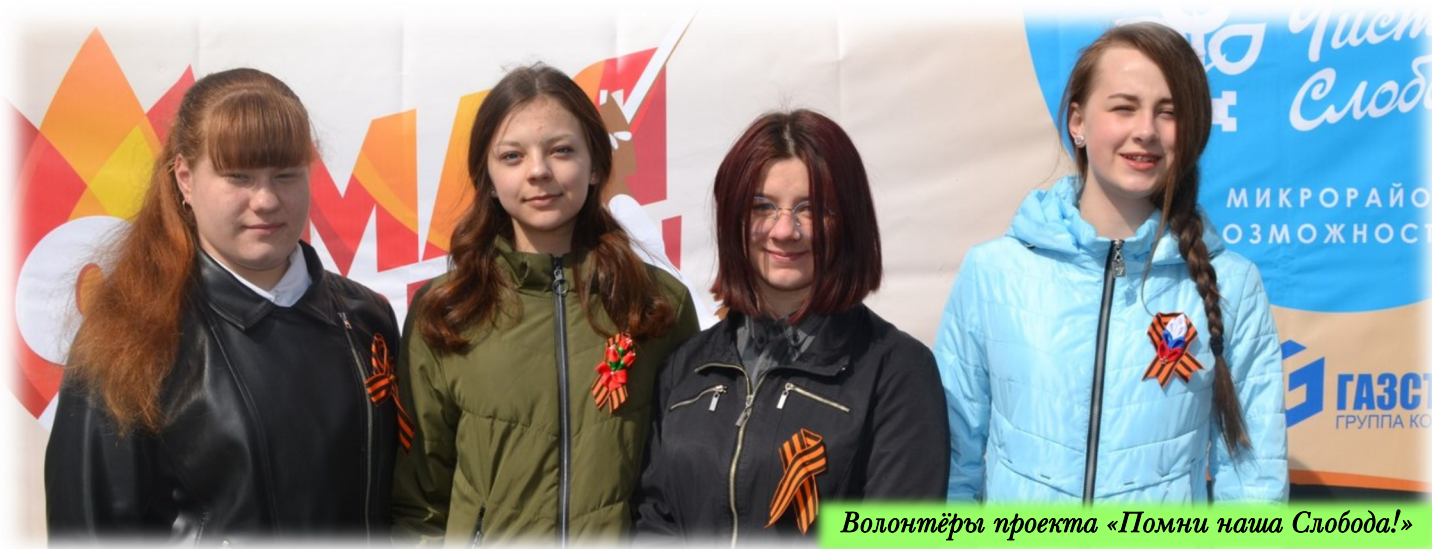
Волонтеры проекта «Помни наша Слобода!»